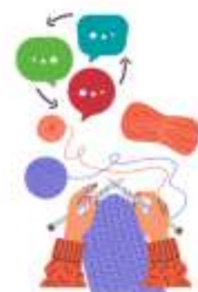
Tricot, artisanat et placotage