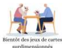
Bientôt des jeux de cartes surdimensionnés