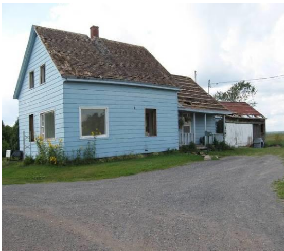
Maison des Lachapelle lors de sa démolition en août 2011. L'ancien toit était en bardeaux. Après le corps principal, la «cuisine d'été», suivie de l'atelier surbaissé qu'on voit mieux sur la photo de du haut, puis du garage (porte blanche).

Voici les familles qui ont cultivé le plus longtemps les fermes du «Japon». Le 18D : avant 1860 à 1903, Brunelle (+ de 43 ans); 1903 à 1965, Lachapelle (62 ans); 1965 à 2009, Gévry (44 ans). Le 19F : 1866 à 1965, Lachapelle (99 ans); 1965 à 2009, Gévry (44 ans). Le 19G : 1836-42 à 1903, Racicot (61 à 67 ans), 1921 à 2009, Gévry (88 ans).