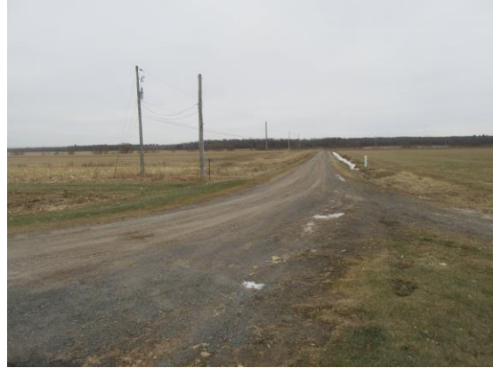
Le «Japon» ou route Beauregard Nord, section parallèle au 3 e Rang Ouest. À gauche, vue vers l'ouest; à droite, vue vers l'est.

Dans la tradition populaire, une section de Sainte-Cécile, la route Beauregard Nord, est désignée par «Le Japon». Qu'en est-il de cette appellation? Nous n'avons trouvé aucun document notarié justifiant cette tradition. Il faut plutôt y voir une façon de nommer un endroit éloigné du reste de la paroisse, difficilement accessible, comme le Japon pour les gens de l'époque.