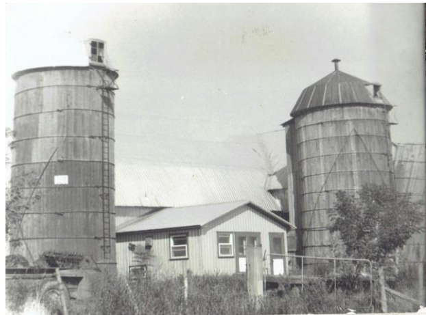
Photo de gauche : Grange des Racicot-Lachapelle vers 1975 jumelée perpendiculairement à celle déjà en place au 808, 3 e Rang Ouest.

Photo de droite : On aperçoit le faite de cette grange à gauche du deuxième silo. L'ensemble des granges a brûlé le 3 septembre 2009, les anciens silos n'existant plus.