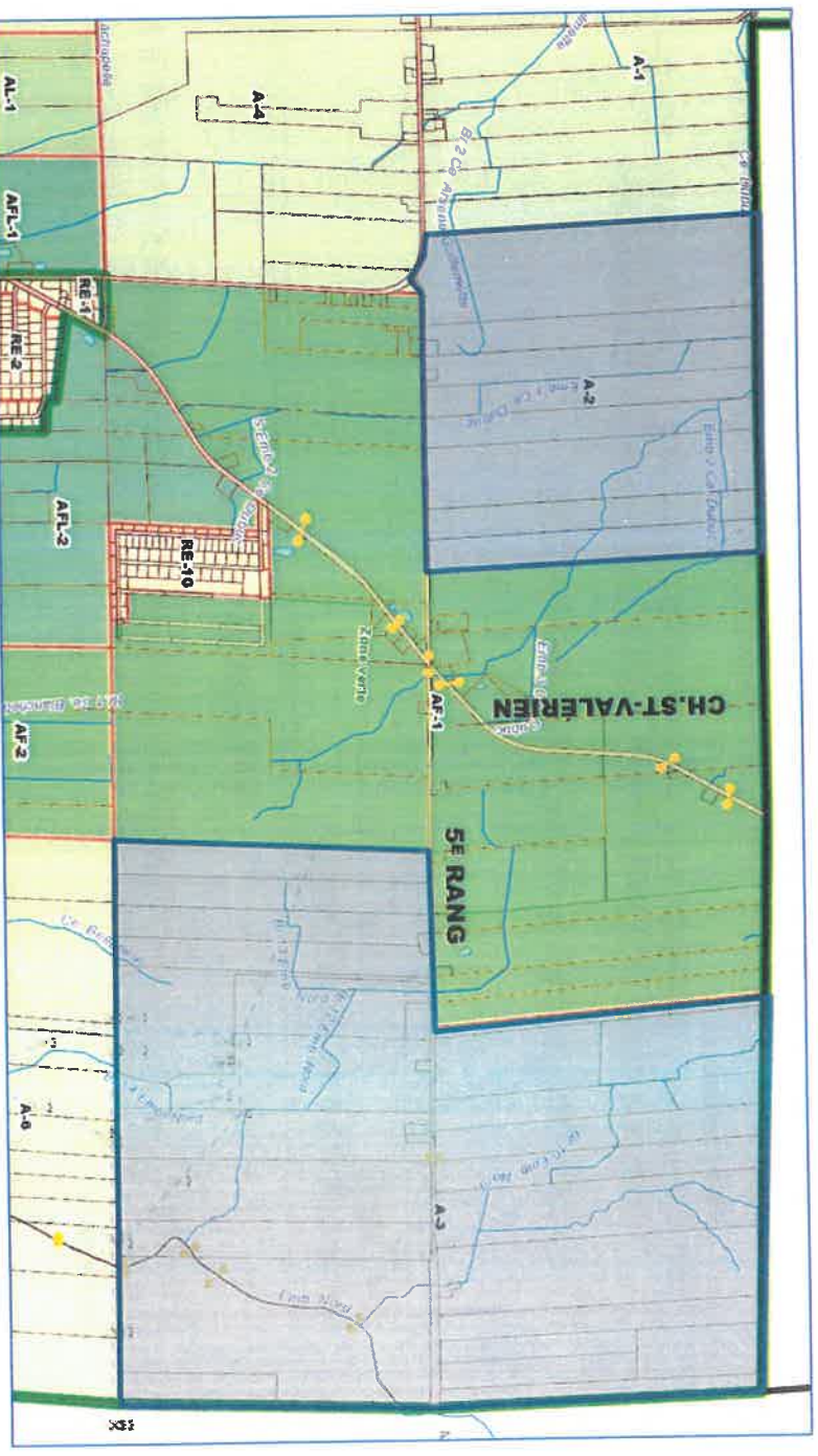
LOCALISATION DES ZONES A-2 ET A-3