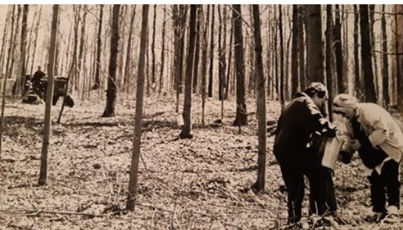
Collecte d'eau d'érable, Érablière Martin 1990

Souvent ces corvées tournaient en petites fêtes! On mangeait du jambon, des crêpes, du lard, des œufs dans le sirop, des « oreilles –de-christ », des beignets et des délicieux « grands-pères » (pâte au sirop). Imaginez... ce temps des sucres et de petites gourmandises était en même temps que le Carême!