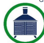
Installations avec pare-étincelles

Loi sur l'aménagement durable du territoire forestier, 2010, c. 3, a. 239.