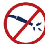
Instruments produisant des flammèches