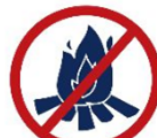
Feux de camp